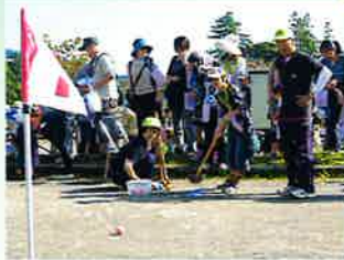
昨年の様子(ホールインワンゲーム)