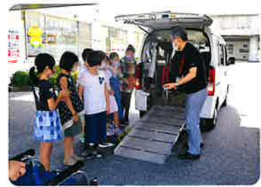
▲ボランティアスクールの開催