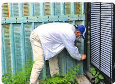
▲困りごとサポート事業