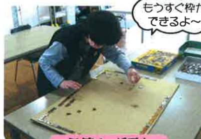
もうすぐ枠ができるよ~