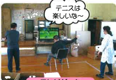
テニスは楽しいな~