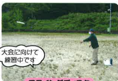
大会に向けて練習中です