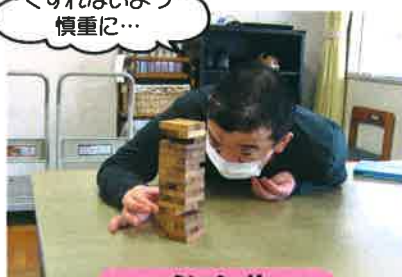
<ずれないよ>慎重に...