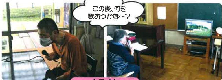
この後、何を歌おうかな~?

さくらんぼの家では、楽しみの1つとして、月に1回余暇活動を行っています。余暇活動の内容は、毎回利用者のみなさんの要望を取り入れています。今回は、テレビゲームをはじめ、1000ピースのジグソーパズル、ジェンガ、カラオケ、フライングディスクとみんなそれぞれ自分のやりたいことを楽しんで行いました。