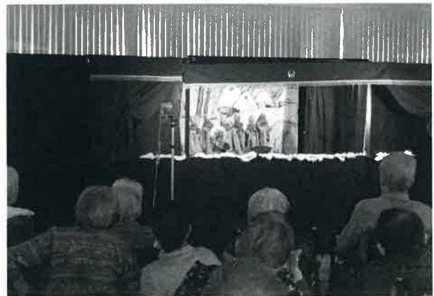
優・悠・邑 和合での上演

愛・あい座さんは今回で288回目の上演。300回を目指して、たくさんの笑顔のために団員のみなさんにがんばっていただきたいと思います。