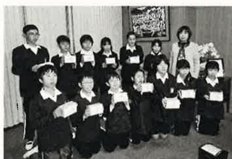
社会福祉協議会 の方へ