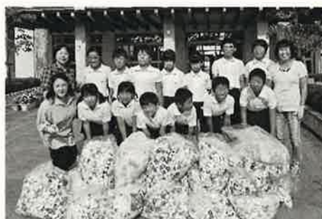
関ヶ原町商工会 を通じて寄付