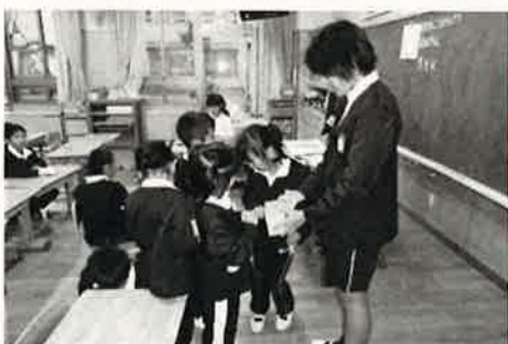
各学級への よびかけ

赤い羽根共同募金は、「町をよくするため」「助けを必要とする人たちのため」「災害の時」に使われることを全校に呼びかけ、活動しました。