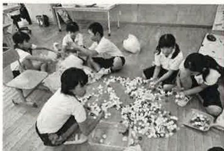
キャップの 仕分け

小学校、幼稚園に呼びかけて、ペットボトルキャップを集めました。委員会の時間、シールをはがしたり、キャップ以外のものを取り除いたりしました。ゴミとして焼却すれば、たくさんのCO 2 が出ますが、この活動することにより、世界の子どもにポリオワクチンを購入することができます。