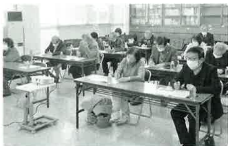
▲熱い講義に耳を傾けました

SVC関ヶ原は、関ヶ原町で大規模災害が発生したときに社協が設置運営する災害ボランティアセンターで、社協とともに支援活動に携わるボランティア団体です。日頃から防災や被災者支援などについて研修をおこなったり、災害ボランティアセンター設置運営訓練をおこなっています。