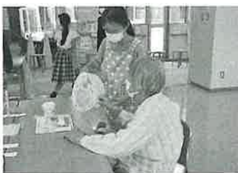
◀▼ ボランティアスクール