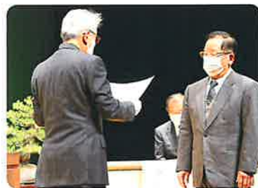
▲社会福祉大会の開催