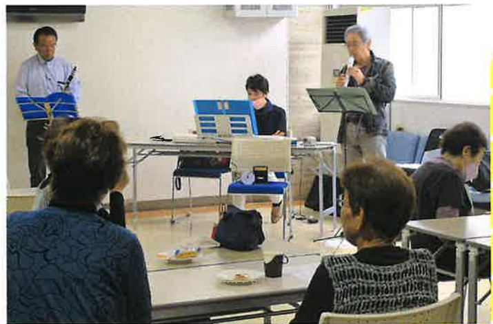
▲演奏会が開かれ、たくさんの昔懐かしい曲が披露されました

毎週月曜日、地域の方々の憩いの場として開か れ、お揃いのTシャツとエプロン姿の会員のみな さんが笑顔で迎えてくださいます。みなさん参加 してみたいはいかがでしょうか？