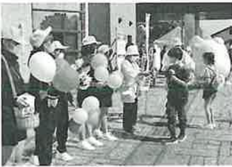
▲▶ 赤い羽根共同募金活動