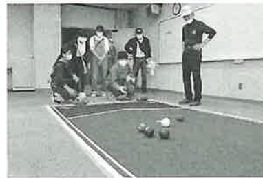
◀ ふくしフレンドパーク ボッチャ体験