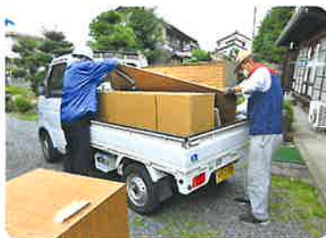
▲困りごとサポート事業