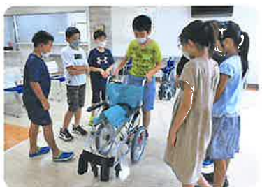
▲ボランティアスクールの開催