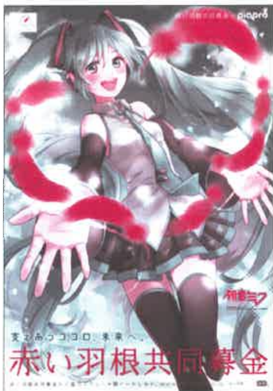
「初音ミク」コラボポスター

illustration by さきっこ © Crypton Future Media, INC. www.piapro.net piapro