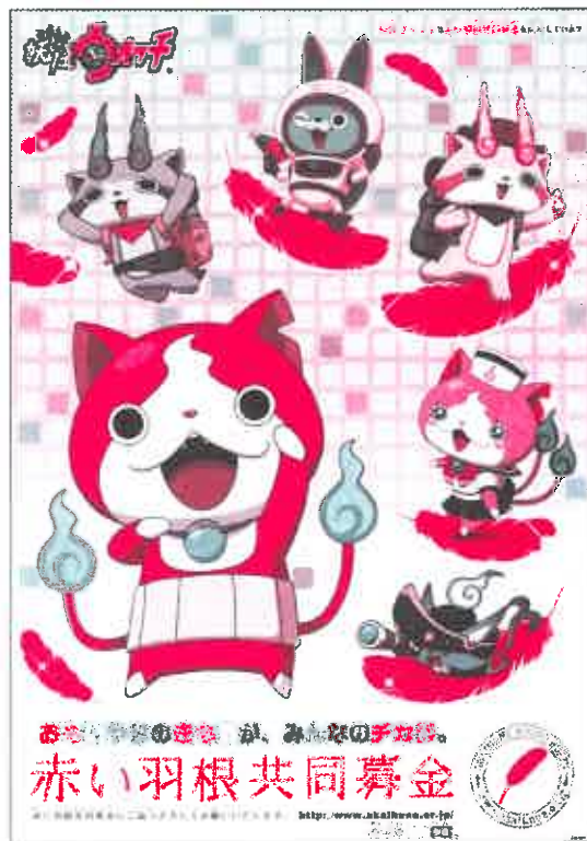
「妖怪ウォッチ」コラボポスター

illustration by さきっこ © Crypton Future Media, INC. www.piapro.net piapro