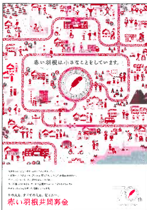
今年度全国統一ポスター