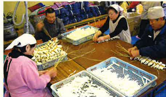
▲藁で編み込む、伝統的な作り方です。