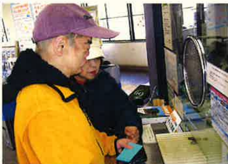
▲大垣までお願いします。