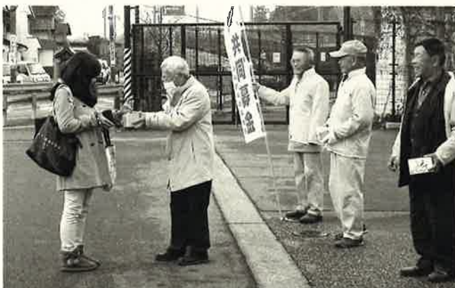
たくさんの方々が足を止めて募金をしてくださいました。(12月2日 JR 関ヶ原駅前にて歳末たすけあい募金)