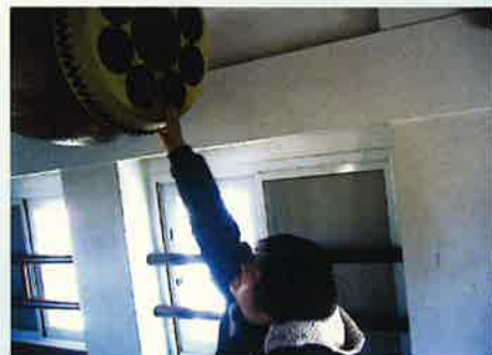
▲どんな音がするだろう〜？

1月31日（金）、さくらんぼの家の所生さんとあしたば会ボランティアさんで大垣市へ社会学習に行ってきました。まず始めに、関ヶ原駅で一人ひとり切符を買い、電車に乗ってさあ出発です。ガタンゴトンと電車にゆられながら、わくわくドキドキ。これからどんなところに行くのかな〜と期待に胸を膨らませながら、大垣駅に到着しました。