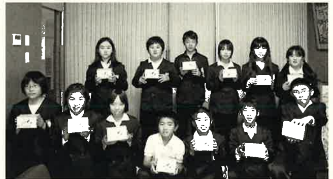
町内の小中学校のみなさんから、あたたかい気持ちをいただきました。

運動期間中には、各種団体、企業、ボランティア、そして小中学校のみなさまにご協力いただきました。心より感謝申し上げます。