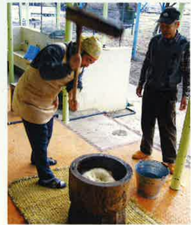
▲ぺったん、ぺったん 「美味しくな〜れ」

雪のちらつく中、あしたば会ボランティアさん、保護者のみなさんと楽しくにぎやかな1日を過ごしました。