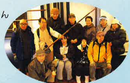
▶ボランティアの皆さんと一緒に「はい、チーズ。」

その後は、楽しみなお昼ごはん と買い物にアクアウォーク大垣へ。おなかもいっぱいになり、お土産を買って、帰りの電車では1日楽しかった出来事の話の花が咲きました。