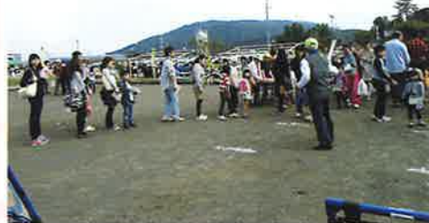
ターゲットゲーム (福祉推進員)