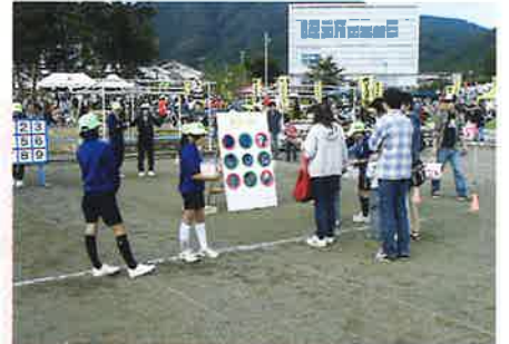
ストラックアウト (福祉協力校)