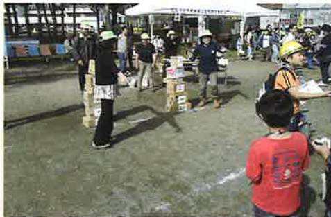
積み木くずし (身体障害者福祉協会)