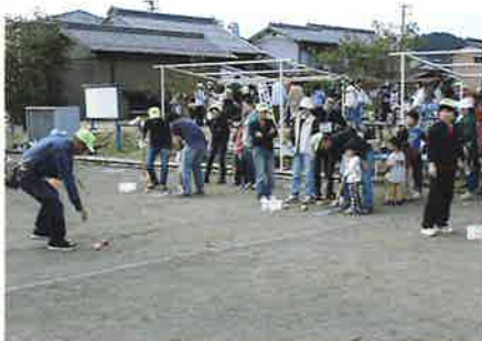
ホールインワンゲーム (老人クラブ連合会)