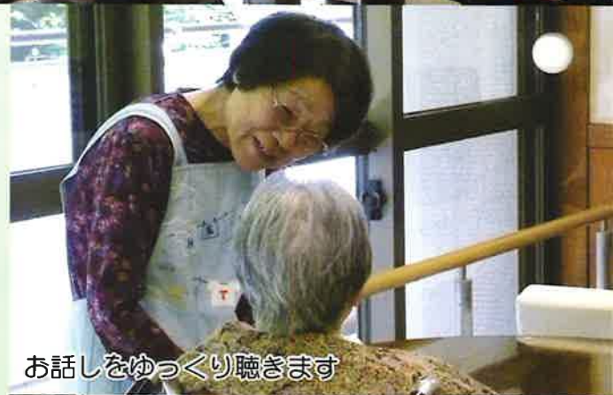
お話をゆっくり聴きます