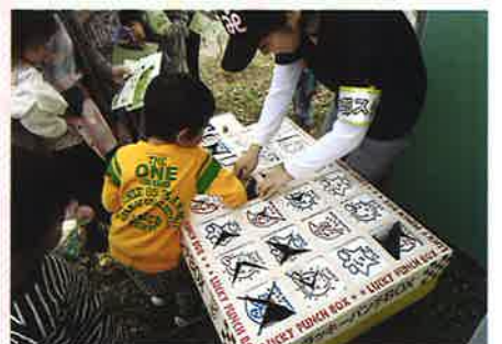
本部 (社会福祉協議会)