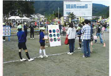
ストラックアウト (福祉協力校)