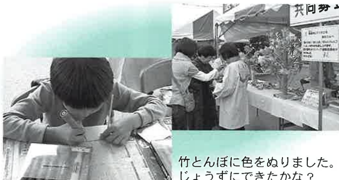
竹とんぼに色をぬりました。じょうずにできたかな？

ボランティア連絡協議会のみなさんに、今年も関ヶ原合戦祭りにおいて共同募金のテントを出展し、募金活動を行っていただきました。募金をしてくれた子どもたちには、手作りの風ぐるま、びゅんびゅんごまや竹とんぼがプレゼントされ、子どもたちは大喜び。みなさんの優しさ・あたたかさがたくさんあつまるとときでした。募金にご協力いただきましたみなさま、ボランティアのみなさま、本当にありがとうございました。