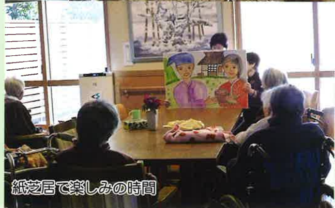
紙芝居で楽しみの時間