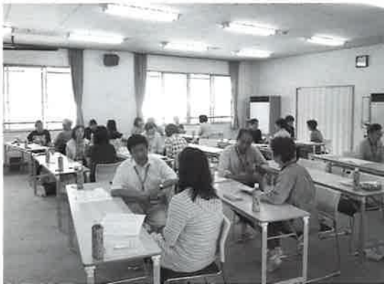
ロールプレイで初めての傾聴体験