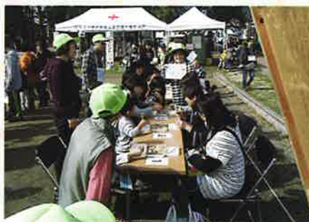
豆つまみ競争 (母子寡婦福祉会)