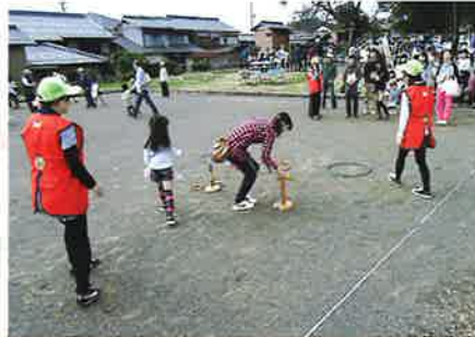
わなげでポイ! (保育園)