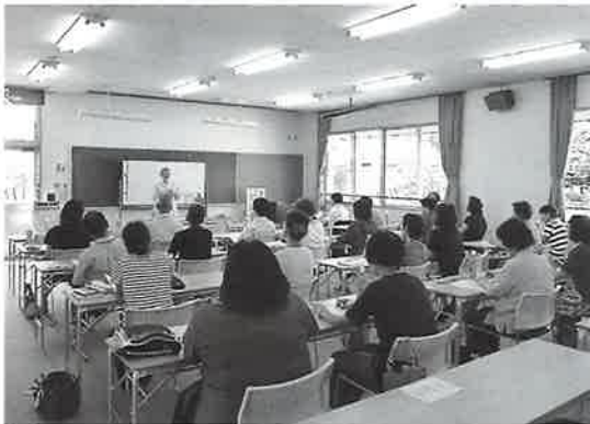
熱心に講義を聴かれました

9月6日(金)と20日(金)の2日間にわたり、「傾聴ボランティア入門講座」を開催しました。