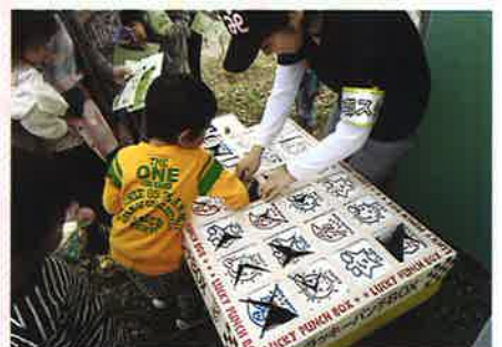
本部 (社会福祉協議会)