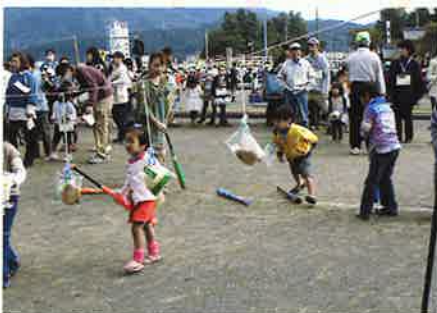
パン食い競走 (民生児童委員協議会)