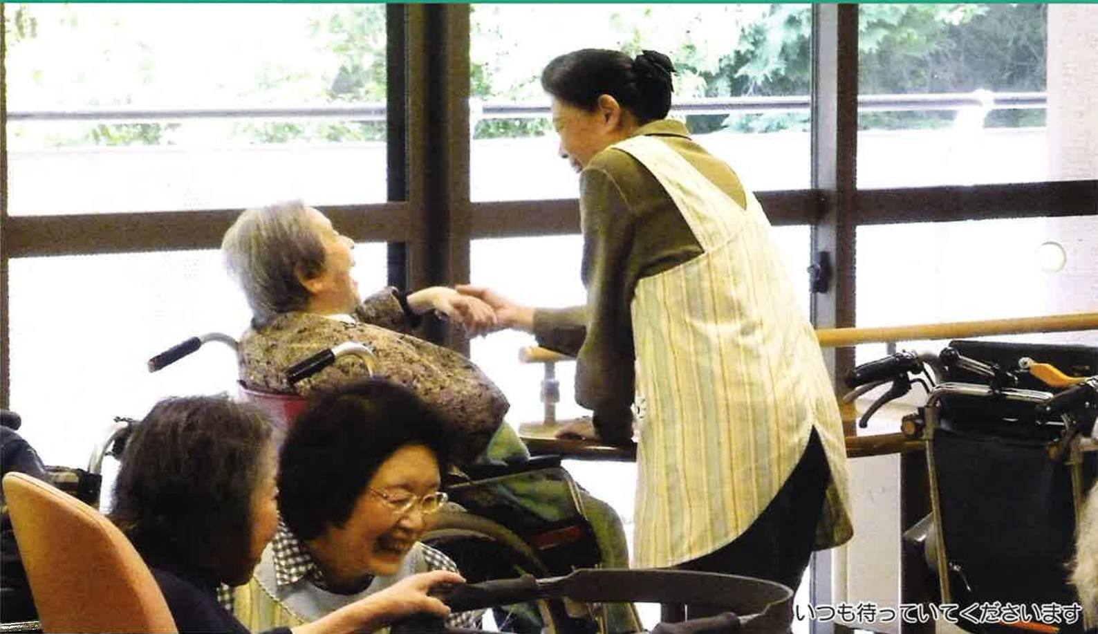
いつも待っていてくださいます

関ヶ原町赤十字奉仕団は赤十字の人道という理念に基づき、さまざまな活動を実践し、奉仕活動をされています。 現在では、特別養護老人ホームへの訪問、ひとり暮らしの高齢者友愛訪問、ボランティア等の活動をされ、またさまざまな講習会にも積極的に参加されています。