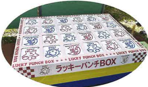
ラッキーパンチボックス☆ 子どもから大人までみんな元気に パンチしました。

10月19日(土) 関ヶ原合戦祭り2013の会場において「第18回ふくしフレンドパーク」を開催しました。