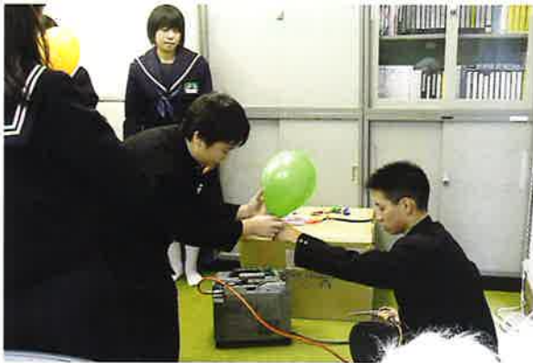
中学生がたくさんの風船を準備してくれました。

10月20日(日)、「関ヶ原合戦祭り2013」の会場において、共同募金の街頭募金を実施しました。あいにくの雨のため、ふれあいセンターにて行いました。中学生・社協職員が「募金にご協力お願いします!」と大きな声で呼びかけ、来場の方々からたくさんのあたたかいお気持ちをいただきました。ありがとうございました。