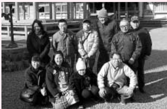
▲みんなで、はいチーズ!!

次に、大垣のアクアウォークに行きました。アクアウォークでは、買い物学習として所生さん一人ひとりが自分のお金で欲しいものを買ったり、お昼ごはんを注文したりしながら、お金の使い方や公共マナーなどを楽しみながら学びました。帰りには、買ったものや食べたものについて会話が盛り上がり、楽しく充実した1日となりました。