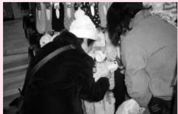
▲さあ、どれがいいかな？