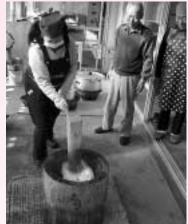
▲力いっぱい、よいしょっ!!

さくらんぼの家で、今年もにぎやかに“もちつき大会”“切り干し大根作り”が行われました。もち米を蒸して、丁寧に杵でこねたらもちつきの開始です。所生さんとあしたば会のボランティアさんと一緒に息を合わせながら力いっぱい杵をふりおろします。みんなでついたおもちは、大根おろしやきなこ、ゆであずきに加え、今年は黒ゴマをからめて、みなさんでおいしくいただきました。また、あしたば会ボランティアさんやさくらんぼの家の保護者のみなさんと、さくらんぼの家でとれた大根で、270本分の切り干し大根を作ったりと、寒い冬ならではの風情を楽しみました。