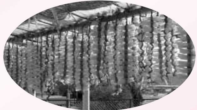
▲わらで編み込み、吊るして干すという伝統的な作り方