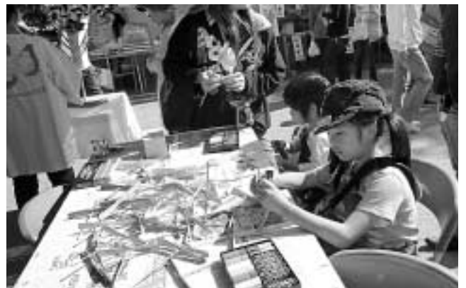
合戦祭りの募金テントでは、ボランティア連絡協議会により、風ぐるまのほか、竹とんぼのプレゼントもあり、子どもたちは色をぬって楽しみました。