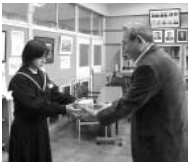
町内の小中学校のみなさんには共同募金についてよく理解していただき、たくさんのお気持ちを寄せていただきました。