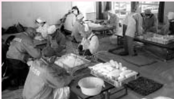
▲みなさん、ありがとうございます。