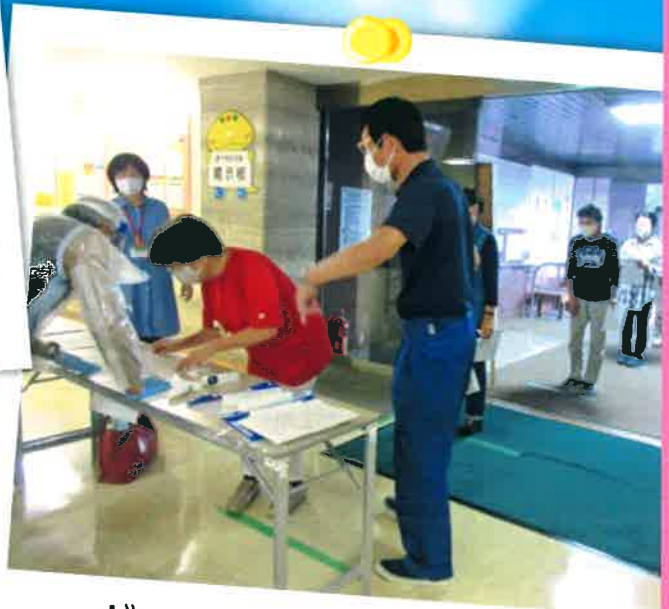
ボランティア活動事業 避難所設営訓練