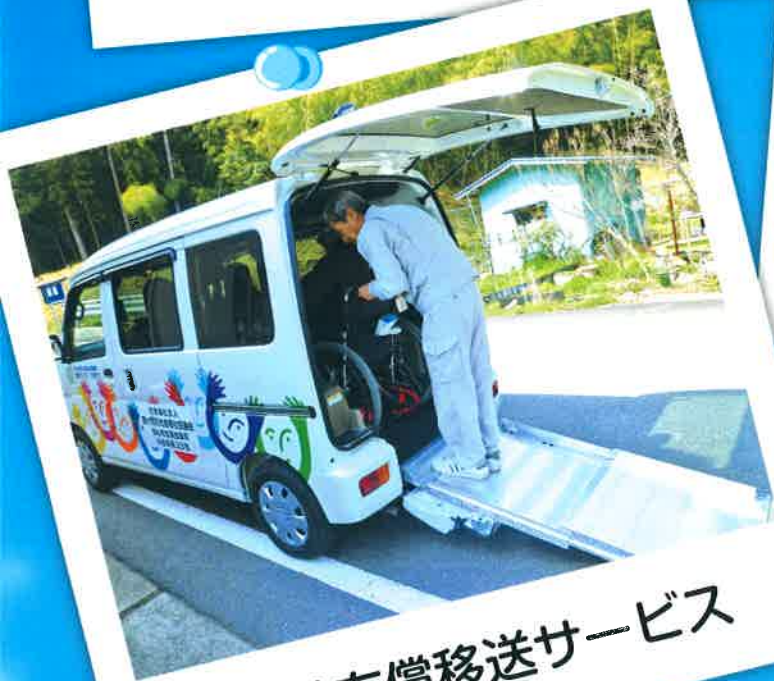
福祉有償移送サービス