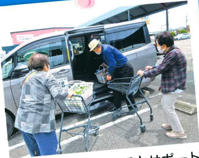
生活支援事業(困りごとサポート) 買い物送迎