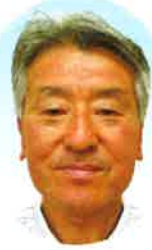
社会福祉法人 関ヶ原町社会福祉協議会